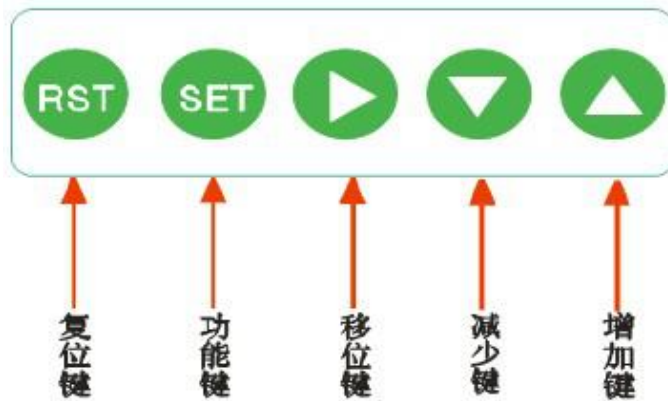
图 5-1 操作键面板