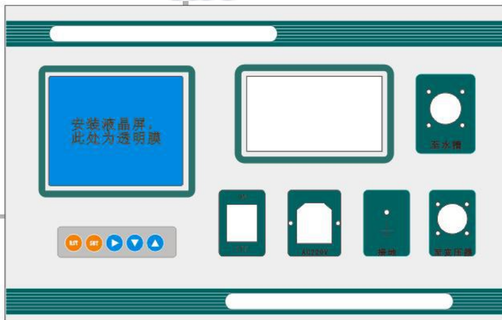
图 3-1 绝缘靴（手套）操作箱