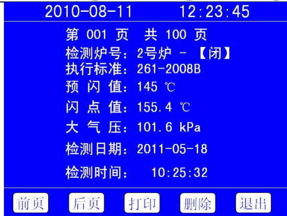
图 6-3 历史记录

按“前页”、“后页”键顺序查看记录；按“打印”键将该记录通过仪器的微型打印机打印出来；按“删除”键从仪器历史记录中删除该条记录；按“退出”键返回画面 6-1。