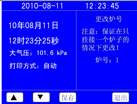
图 6-2 参数设置

用手指触摸（或用触摸笔触摸）要修改的项目；用“▲”、“▼”键，调整选中的数字；调整完毕后按下“保存”键，将当前的调整数值写入仪器；按“退出”键返回画面 6-1。