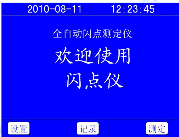
图 6-1 开机界面图