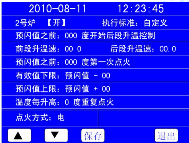
图 6-5 自定义参数设置

◆用手指触摸（或用触摸笔触摸）炉号下面的“执行标准”、“预闪值”对应的参数，选中后用“▲”、“▼”键，调整选中的数字或文字；当选择“执行标准”参数后，按“▲”、“▼”键选择执行标准，当执行标准为“自定义”时，这时按两次“自定义”进入自定义参数设置画面，如图 6-5