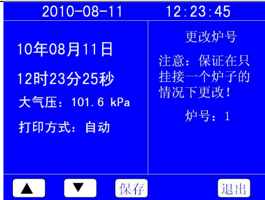
图 6-2 参数设置

用手指触摸（或用触摸笔触摸）要修改的项目；用“▲”、“▼”键，调整选中的数字；调整完毕后按下“保存”键，将当前的调整数值写入仪器；按“退出”键返回画面 6-1。