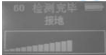
(4). 68K 接地量程 2 接地实测波形